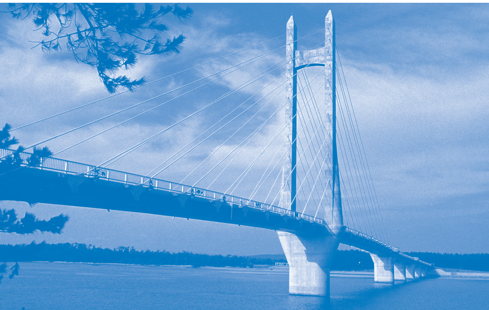
サンセットブリッジ（南さつま市）