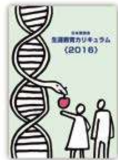
生涯教育カリキュラム(2016)