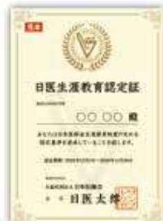
日医生涯教育認定証