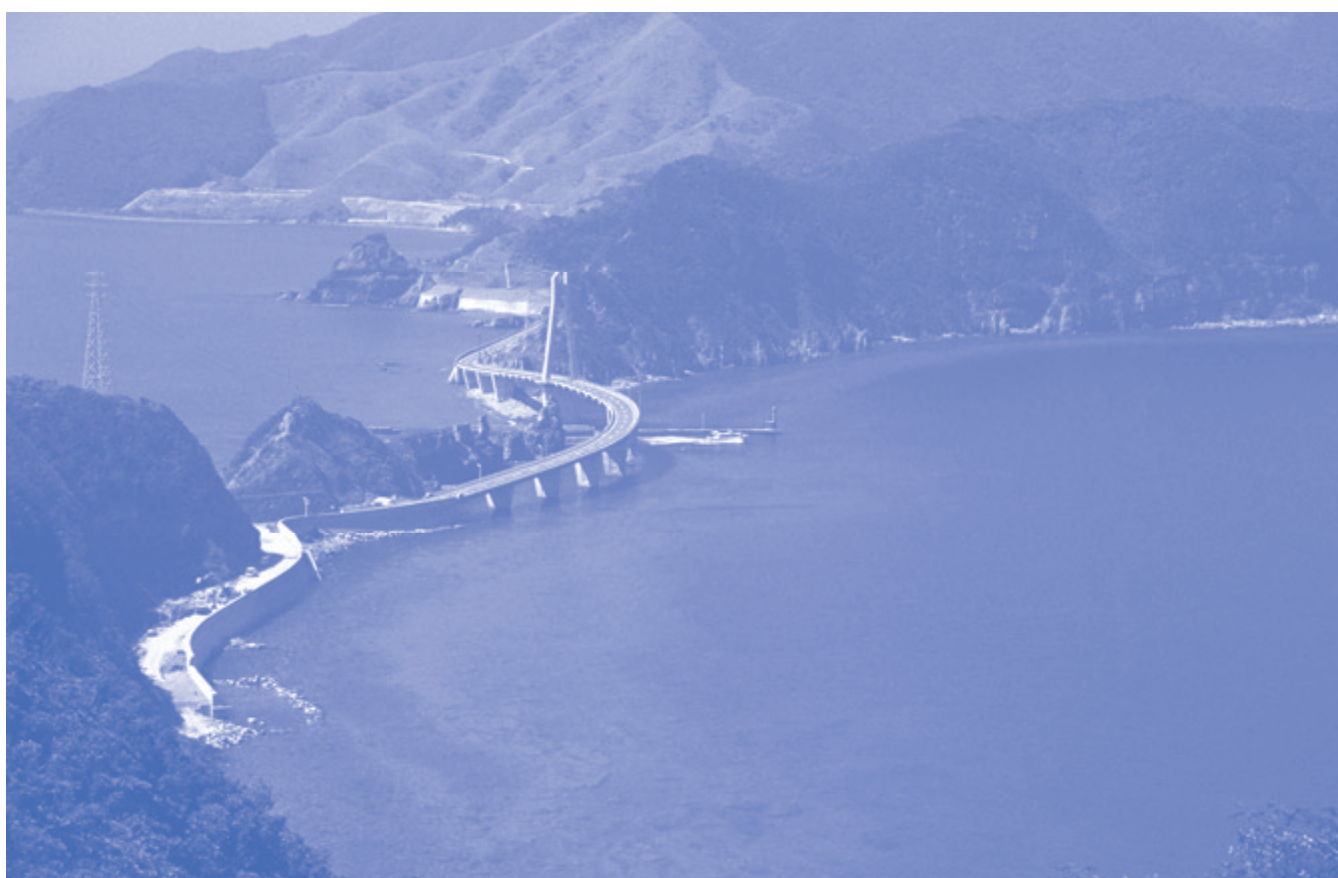
甌大明神橋(薩摩川内市)